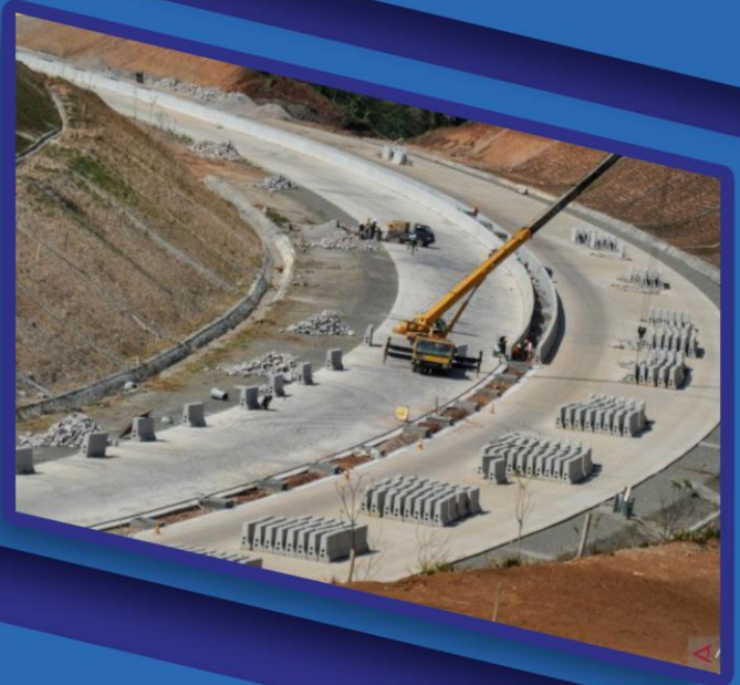
2. Tol Cisumdawu Seksi 1, Sumedang, Jawa Barat, PT Wijaya Karya (Persero) Tbk