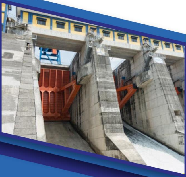
1. Jatigede Hydro Electric Power Plant Project, Sumedang, Jawa Barat - Sinohydro-PP J.O