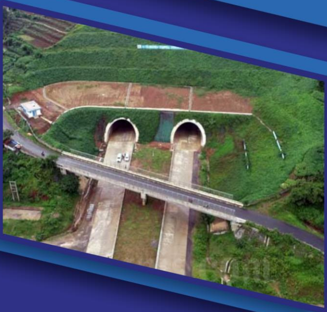
3. Tol Cisumdawu Seksi 2, Sumedang, Jawa Barat, PT Waskita Karya (Persero) Tbk